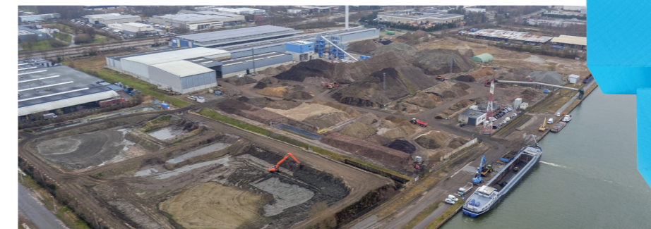
Bioterra - Genk